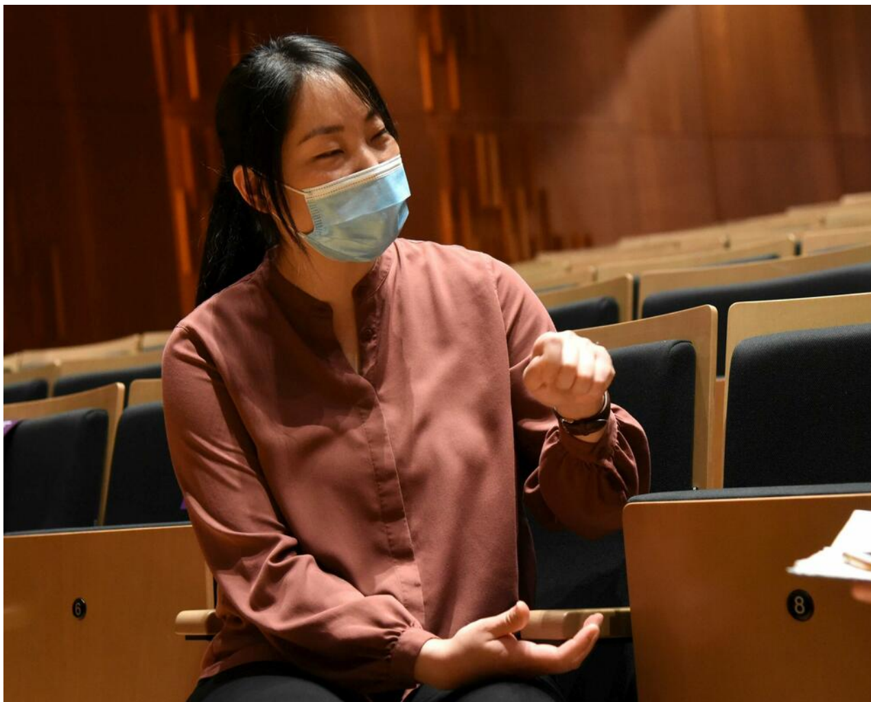
Holi Hjun Čo

Na Velikoj sceni Muzičkog centra nastupiće duvački i gudački ansambli CSO-a, redukovani sastav Crnogorskog simfonijskog orkestra, kao i kontrabasista CSO-a Vasilije Gagović koji će izvesti solističku dionicu.